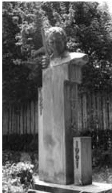
Համլեւ Քոչարյանի կիսանդրին

Սեւաքարի գյուղապետարանին մերձ հուշայգին է, որտեղ հուշարձան է կանգնեցված Երկրորդ աշխարհամարտում ընկած սեւաքարցիների հիշատակին: Արցախյան պայքարում համայնքը եւս կորուստներ է ունեցել: 1991-ի մայիսի 6-ին ակամի փորձարկման ժամանակ ստացած