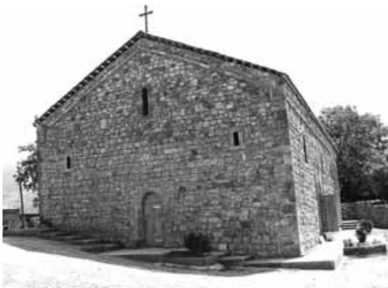
2013թ. վերականգնված Սեւաքարի Սբ Յովհաննես եկեղեցին

րասիրության արժանացել գյուղում: Ինչեւէ, այժմ անհրաժեշտ է եկեղեցու տարածքը բարեկարգ տեսքի բերել, որից հետո այն կծառայի համայնքի (եւ ոչ միայն) հավատավոր մարդկանց: